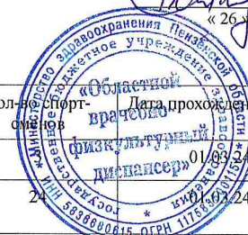
ГРАФИК прохождения углубленного медицинского обследования лицами, занимающимися спортом, на Март 2024 г.

УТВЕРЖДАЮ Главный врач ГБУЗ «ОВФД» В.П.Савельев «26» февраля 2024 г.